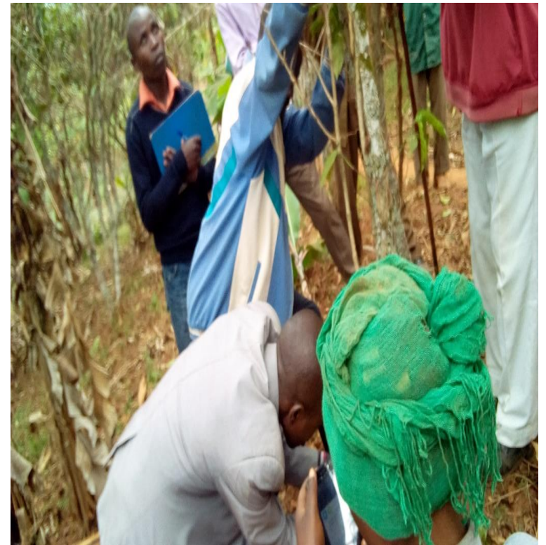
Sessions de formation sur l'entrepreneuriat coopératif et les bonnes pratiques agricoles en matières de café Photos GDIBU, Février-Mars 2019