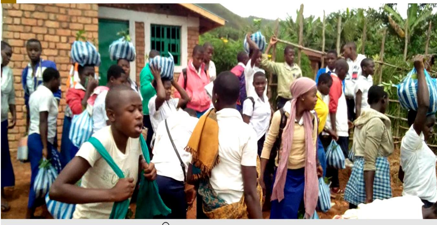
Séance de Distribution des plantules

8751 plantules de caféiers arabica Ruiru 11 et Blue Montain ont été distribués et d'autres seront distribués en octobre 2019 en remplacement de ceux qui ne résisteraient pas à la saison sèche (mois de Juin-Août)