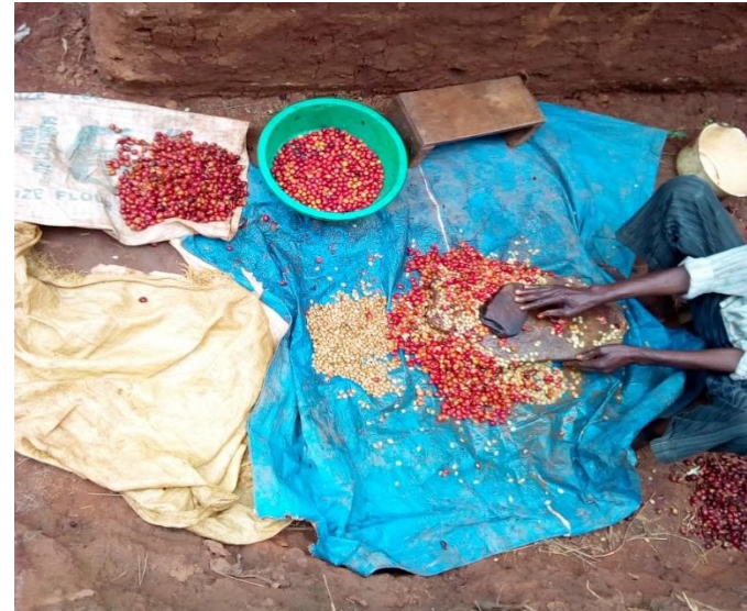
Dépulpage café avant-projet