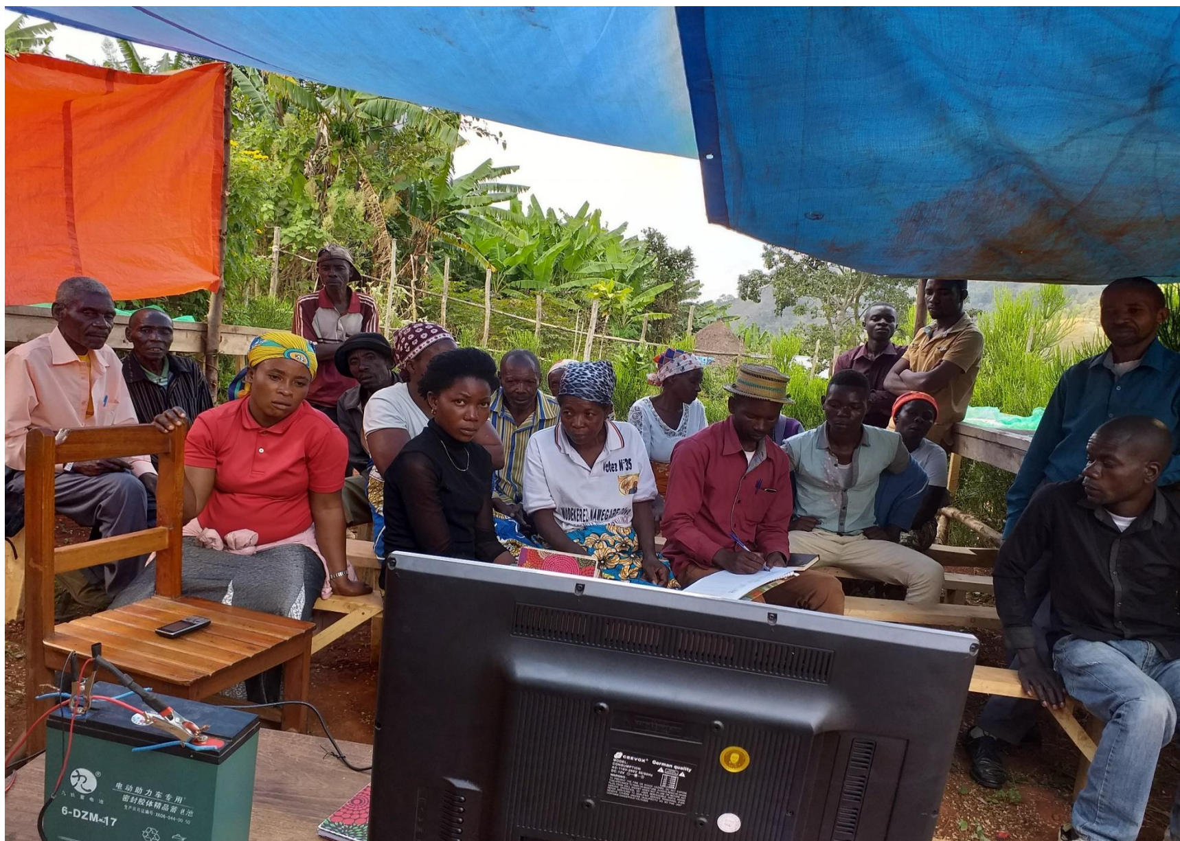
Séance de restitution LTC, projection mini film sur l'association des cultures -café-bananier et le BXW qui attaque le bananier