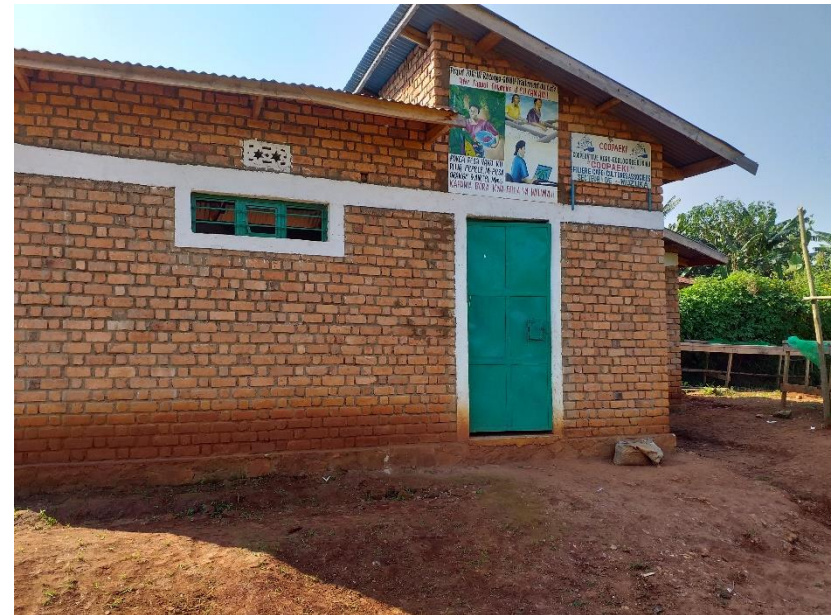
Le bâtiment abritant le projet