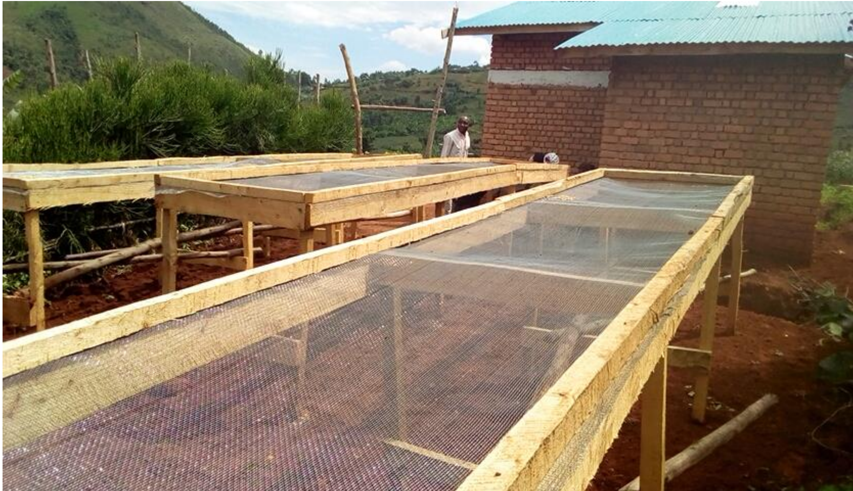
Les tables de séchages /séance de montage