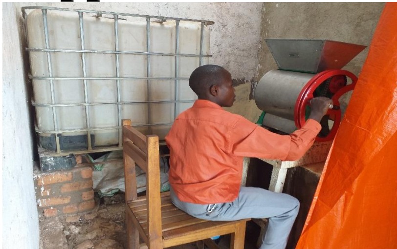
Dépulpage café avec le projet

Nos sincères gratitudees à l'équipe de EU Can Aid! et à toutes les personnes de bonne volonté qui ont rendu possible la réalisation de ce projet , unique en son genre dans le territoire de Walungu en RDC.